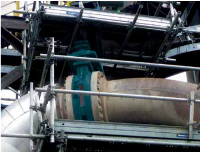
300 磅级手动隔离 KSV 刀闸阀在 350 psi 下处理尾矿的速度为 13-14 英尺/秒。

该阀门的多种特性特别适用于高压、高密度浆液管线的隔离。该阀门具有坚固的一件式阀体、100%全口径、硬化处理闸板以及可旋转的阀座环,是最严苛应用的理想选择。KSV 阀门的压力/温度额定值为 ASME B16.34 150 和 300 磅级,尺寸为 3-60" (80-1500mm)。